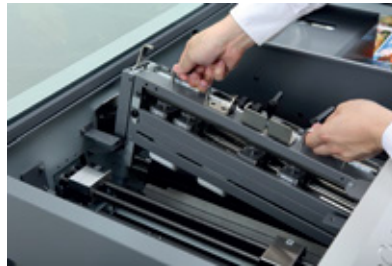
Unidad de perforación