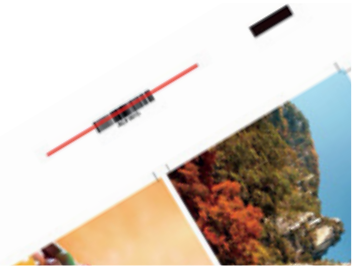
Lector de código de barras